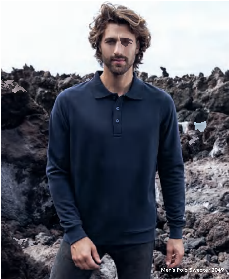
Men's Polo Sweater 2049