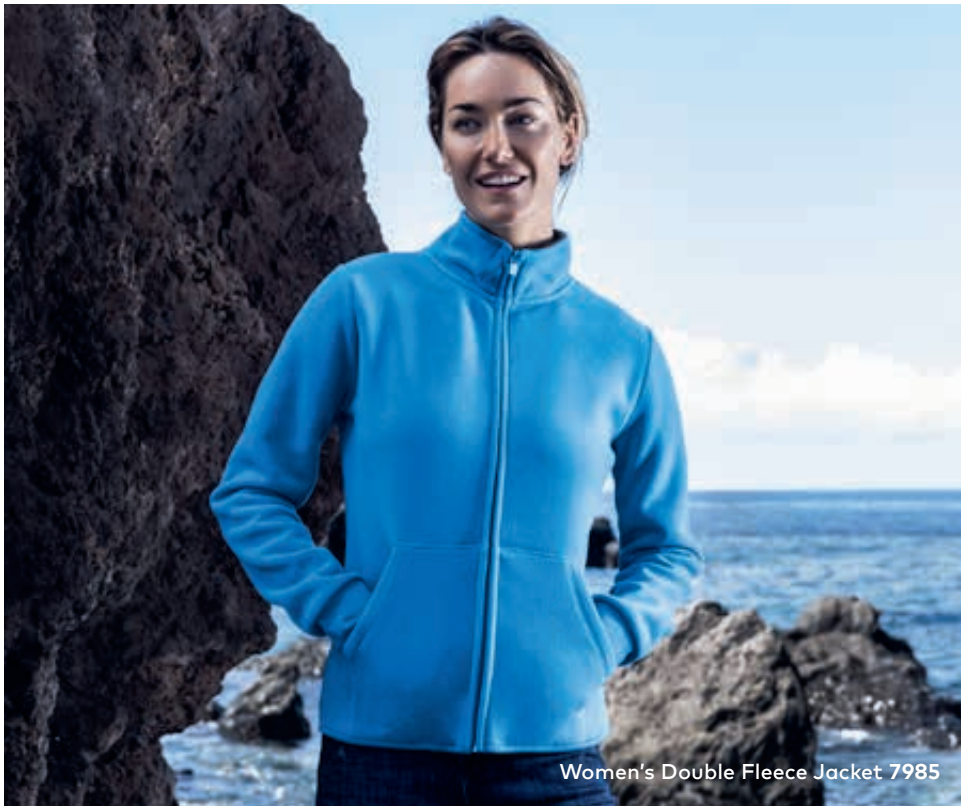
Women's Double Fleece Jacket 7985

Double-Fleecejacke mit Stehkragen und durchgehendem verdecktem Reißverschluss, Elasthanbündchen an Ärmeln sowie Einschubtaschen mit Ziernaht. Die Innenseite der Jacke ist in Kontrastfarbe, hergestellt aus Polyester mit beidseitiger Anti-Pilling-Ausrüstung. Die Fleecejacke ist schmal geschnitten.