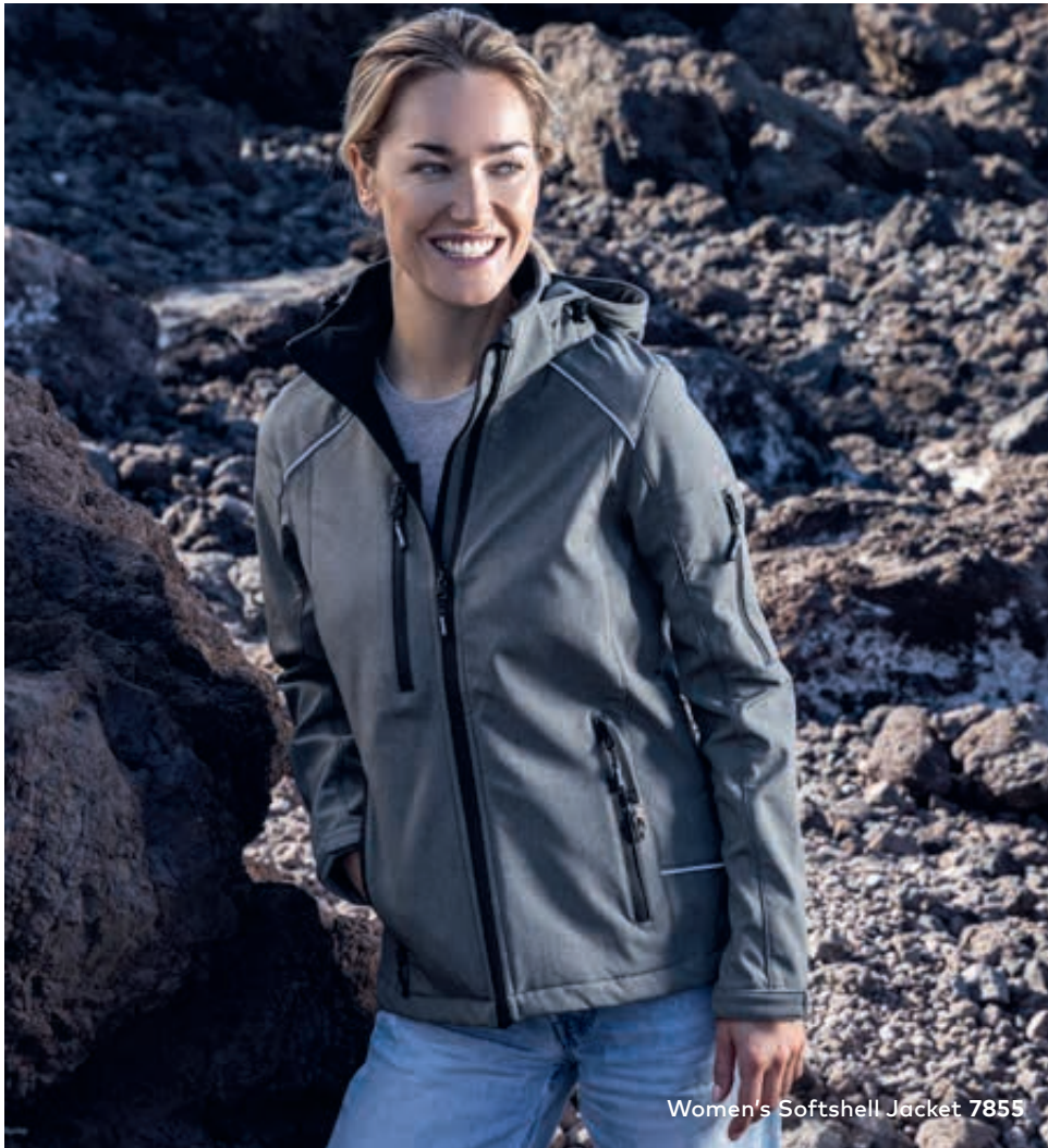
Women's Softshell Jacket 7855