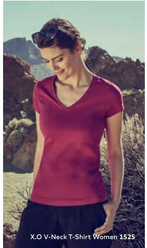
X.O V-Neck T-Shirt Women 1525

Einzigartiges Single-Jersey T-Shirt mit V-Ausschnitt und Self-Fabric Kragen, hergestellt aus langstapeliger gekämmter Baumwolle. Die besonders glatte Oberfläche und der weich fallende Stoff verleihen dem Shirt ein einzigartiges, elastisches und seidiges Finish. Das T-Shirt ist schmal geschnitten und mit Seitennähten gefertigt.