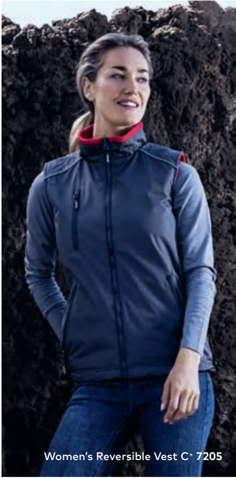
Women's Reversible Vest C+ 7205