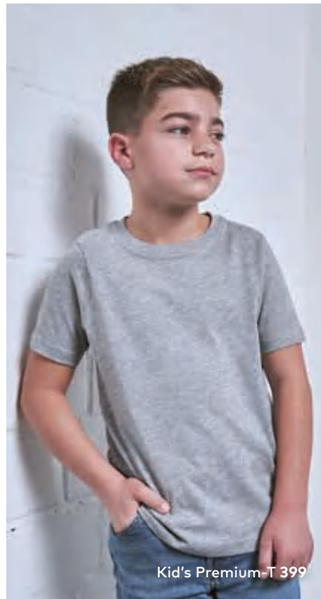
Kid's Premium-T 399

Klassisches Unisex-Single-Jersey-T-Shirt mit Elasthananteil im schmalen Rippbündchen, hergestellt aus langstapeliger gekämmter Baumwolle, die besonders feine Oberfläche ist hervorragend geeignet für jegliche Art der Veredelung. Das T-Shirt ist modern geschnitten und mit Seitennähten gefertigt.