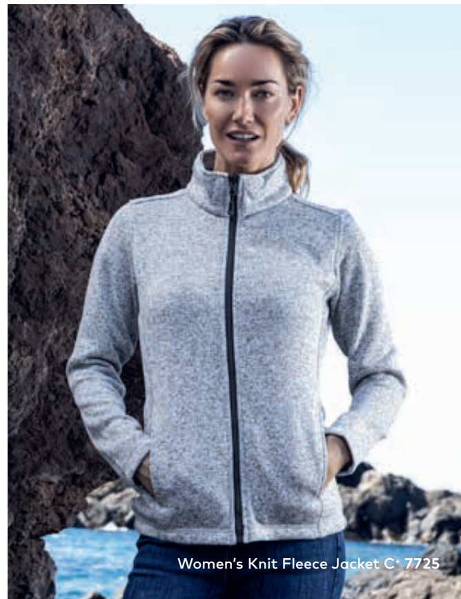
Women's Knit Fleece Jacket C + 7725

Strickfleece-Jacke mit Stehkragen und angerauter Innenseite, durchgehender Reißverschluss in Kontrastfarbe und 2 Seitentaschen auf der Vorderseite sowie Fixierung für Außenjacke, hergestellt aus Polyester. Die Jacke ist schmal geschnitten. Jacken Konzept 6-in-1, kombinierbar mit Außenjacke 7548/7549.