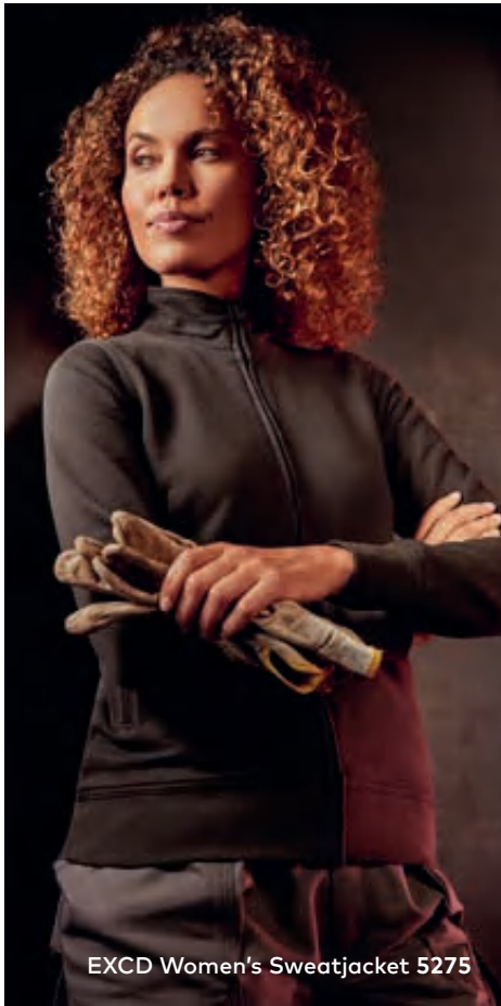
EXCD Women's Sweatjacket 5275