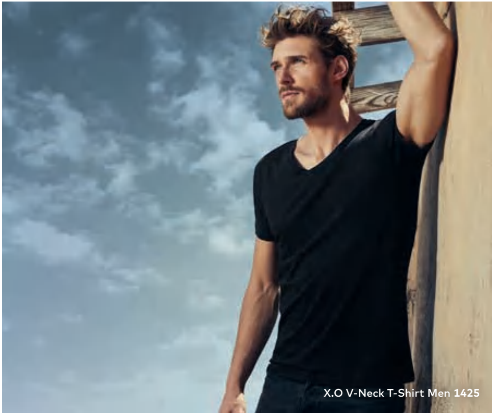
X.O V-Neck T-Shirt Men 1425