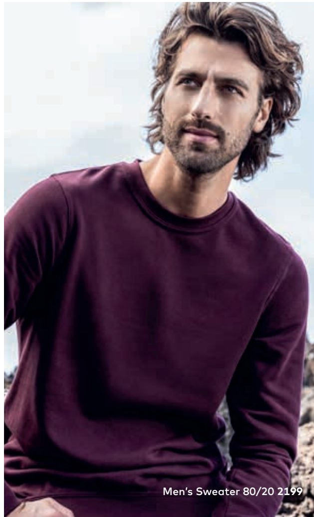
Men's Sweater 80/20 2199

Klassisches Molton-Mischgewebe-Sweatshirt mit angerauter Innenseite und Elasthanbündchen an Hals, Ärmeln und Saum, hergestellt aus gekämmter Baumwolle und Polyester. Das Sweatshirt ist modern geschnitten.