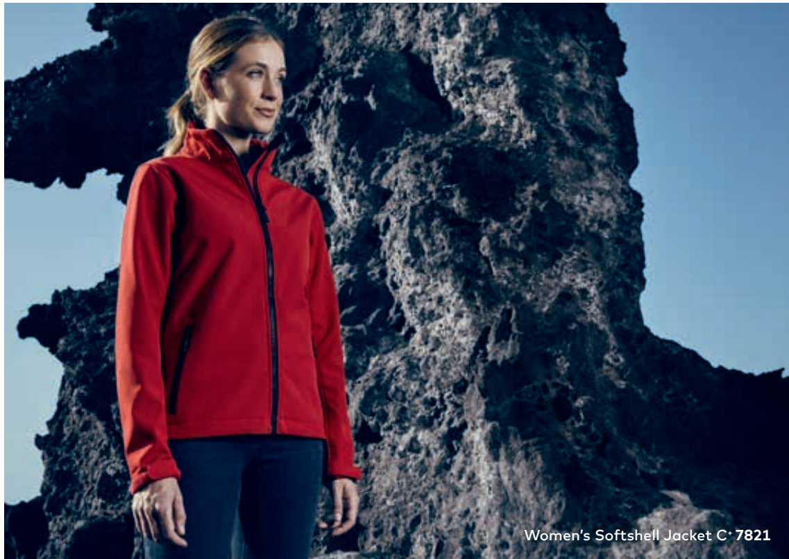
Women's Softshell Jacket C+ 7821