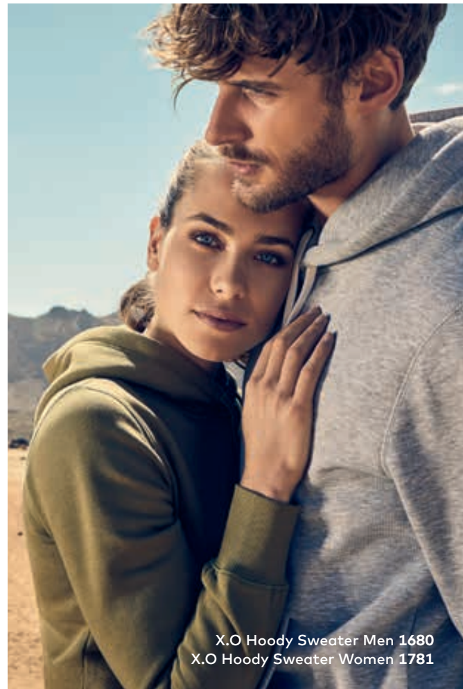
X.O Hoody Sweater Men 1680 X.O Hoody Sweater Women 1781

Einzigartiges Molton-Mischgewebe-Kapuzensweatshirt mit angerauter Innenseite, Kängurutasche und Elasthanbündchen an Hals, Ärmeln und Saum, hergestellt aus langstapeliger gekämmter Baumwolle und Polyester. Die besonders glatte Oberfläche und der weich fallende Stoff verleihen dem Sweatshirt ein einzigartiges, elastisches und seidiges Finish. Das Sweatshirt ist schmal geschnitten.