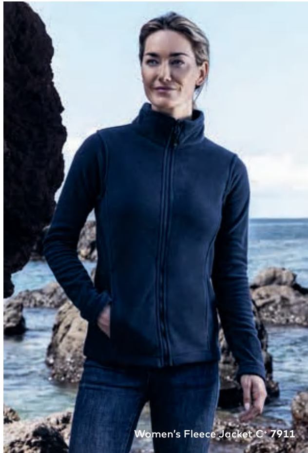
Women's Fleece Jacket C 7911

Microfleece-Jacke mit Stehkragen, durchgehendem Reißverschluss und Einschubtaschen sowie Fixierung für Außenjacke, Anti-Pilling-Ausrüstung, hergestellt aus Polyester. Die Jacke ist sportlich geschnitten. Jacken Konzept 6-in-1, kombinierbar mit Außenjacke 7548/7549.