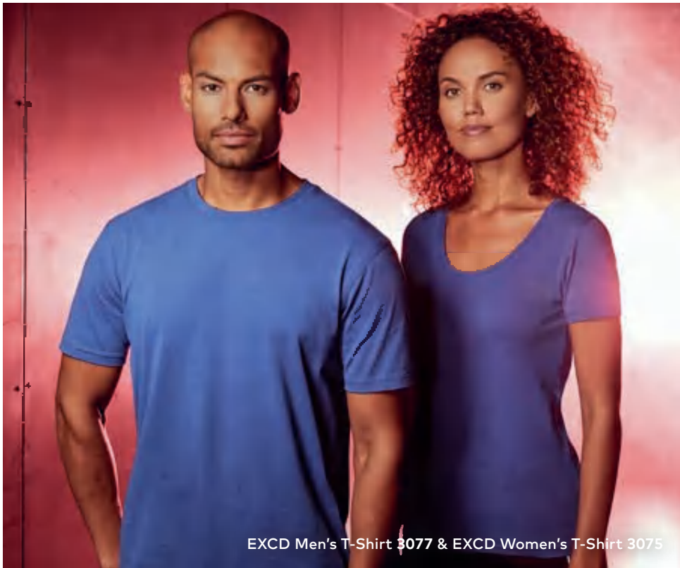
EXCD Men's T-Shirt 3077 & EXCD Women's T-Shirt 3075