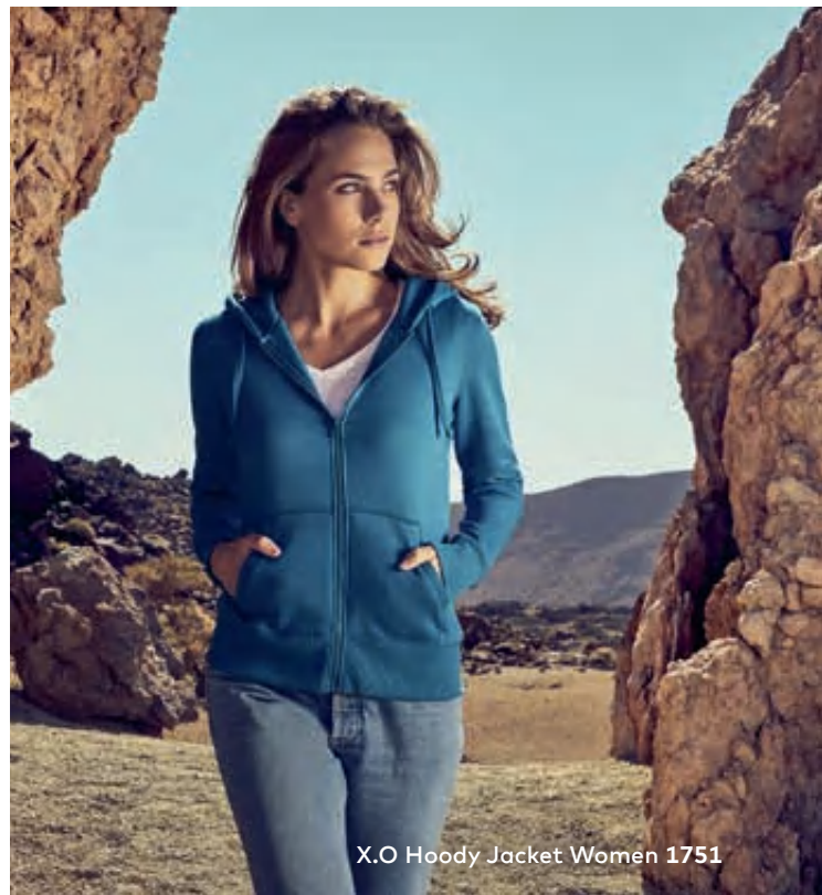
X.O Hoody Jacket Women 1751

Einzigartiges Molton-Mischgewebe-Kapuzensweatjacke mit angerauter Innenseite, Kängurutasche und Elasthanbündchen an Hals, Ärmeln und Saum, hergestellt aus langstapeliger gekämmter Baumwolle und Polyester. Die besonders glatte Oberfläche und der weich fallende Stoff verleihen der Sweatjacke ein einzigartiges, elastisches und seidiges Finish. Das Sweatshirt ist schmal geschnitten.