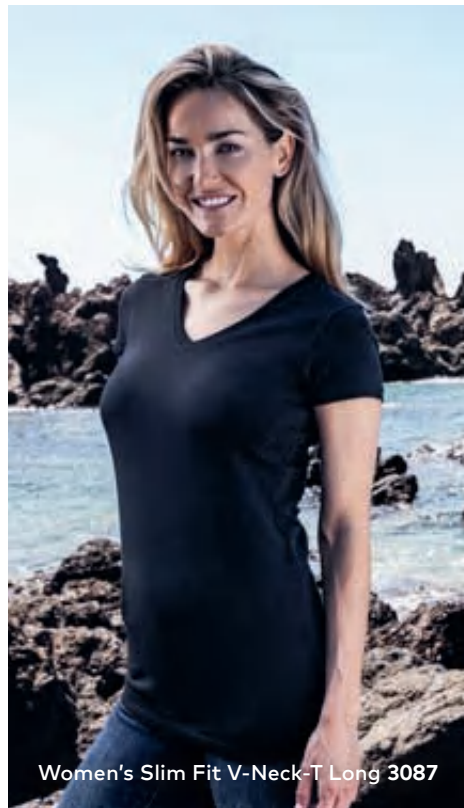
Women's Slim Fit V-Neck-T Long 3087

Modernes extra langes Single-Jersey-V-Ausschnitt-T-Shirt mit Elasthananteil im schmalen Rippbündchen, hergestellt aus gekämmter Baumwolle mit Elasthananteil für mehr Bewegungsfreiheit. Das T-Shirt ist eng anliegend geschnitten und mit Seitennähten gefertigt.