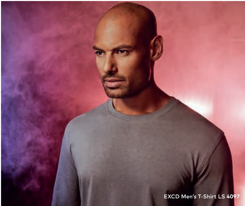
EXCD Men's T-Shirt LS 4097