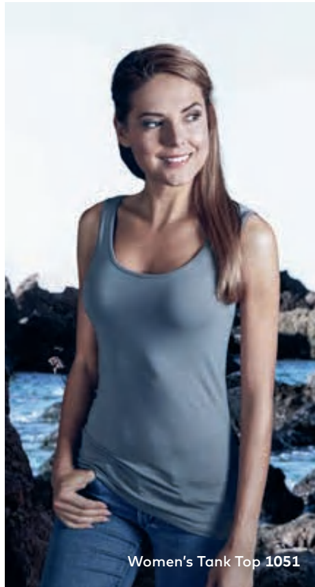
Women's Tank Top 1051

Modernes Single-Jersey-Trägershirt mit eingefasstem Kragen, hergestellt aus gekämmter Baumwolle mit Elasthananteil für mehr Bewegungsfreiheit. Das Trägershirt ist figurbetont geschnitten und mit Seitennähten gefertigt.