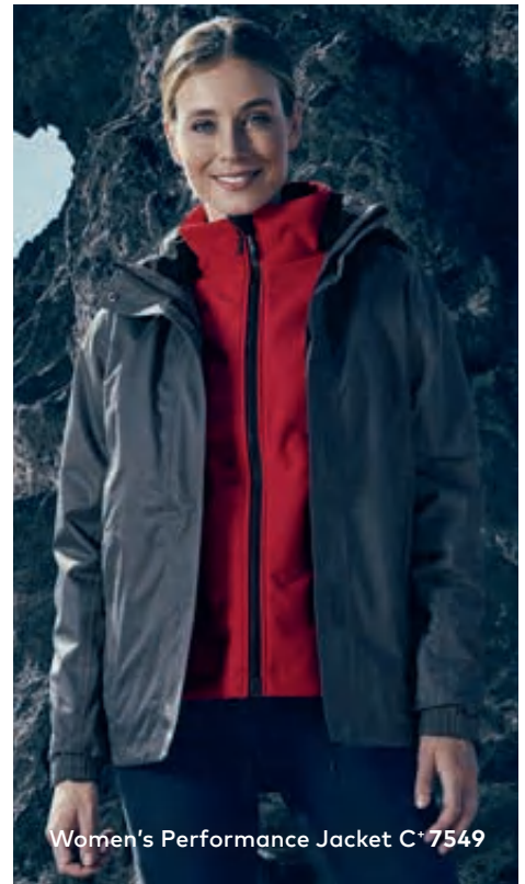
Women's Performance Jacket C + 7549

Performance-Jacke, die besonderen Merkmale dieser Jacke: abnehmbare Kapuze mit Volumenregulierung vorn und hinten, verdeckter 2-Wege-Reißverschluss mit Klettverschluss, verdeckte Napoleontasche mit Reißverschluss, verstellbare Armabschlüsse mit Klettverschlüssen, Tunnelzug am Saum mit Kordelstopper innen, 2 Seitentaschen mit Reißverschluss, Invisible Zip zum Veredeln, Reißverschluss und Fixierung für wechselbare Innenjacke, bedruckbare Fläche innen für Branding, getappte Nähte, PU beschichtet, wasserdicht 5.000mm, winddicht, atmungsaktiv 5.000g/m 2 /24h, hergestellt aus Polyester. Die Jacke ist modern geschnitten. Jacken Konzept 6-in-1, kombinierbar mit folgenden Artikeln: Men: 7200, 7621, 7720, 7820, 7910, Women: 7205, 7622, 7725, 7821, 7911.