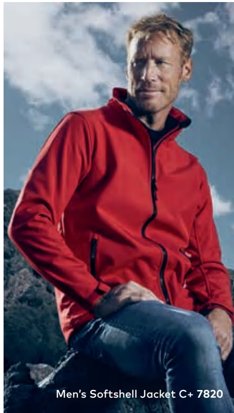
Men's Softshell Jacket C+ 7820

Softshelljacke, die besonderen Merkmale dieser Jacke: Reißverschluss mit Regen- und Kinnschutz, verstellbare Armabschlüsse mit Klettverschlüssen, Tunnelzug am Saum mit Kordelstopper innen, 2 Seitentaschen mit Reißverschluss, Fixierung für Außenjacke, atmungsaktiv, wasserdicht 8.000 mm, hergestellt aus bi-elastischem Bonded-Fleece aus Polyester mit Elasthananteil für mehr Bewegungsfreiheit. Die Jacke ist sportlich geschnitten. Jacken Konzept 6-in-1, kombinierbar mit Außenjacke 7548/7549.