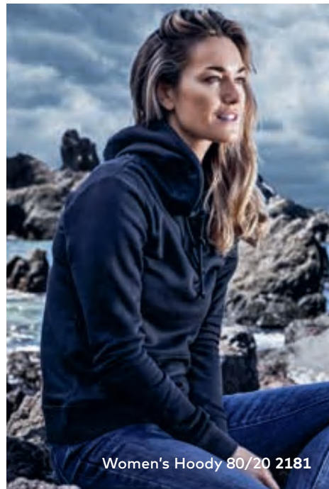
Women's Hoody 80/20 2181

Klassisches Molton-Mischgewebe-Kapuzensweatshirt mit angerauter Innenseite und Elasthanbündchen an Ärmeln und Saum sowie einer Kängurutasche, Doppelkapuze, hergestellt aus gekämmter Baumwolle und Polyester. Das Kapuzensweatshirt ist modern geschnitten.