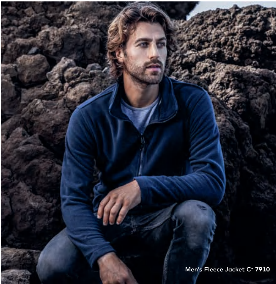
Men's Fleece Jacket C + 7910