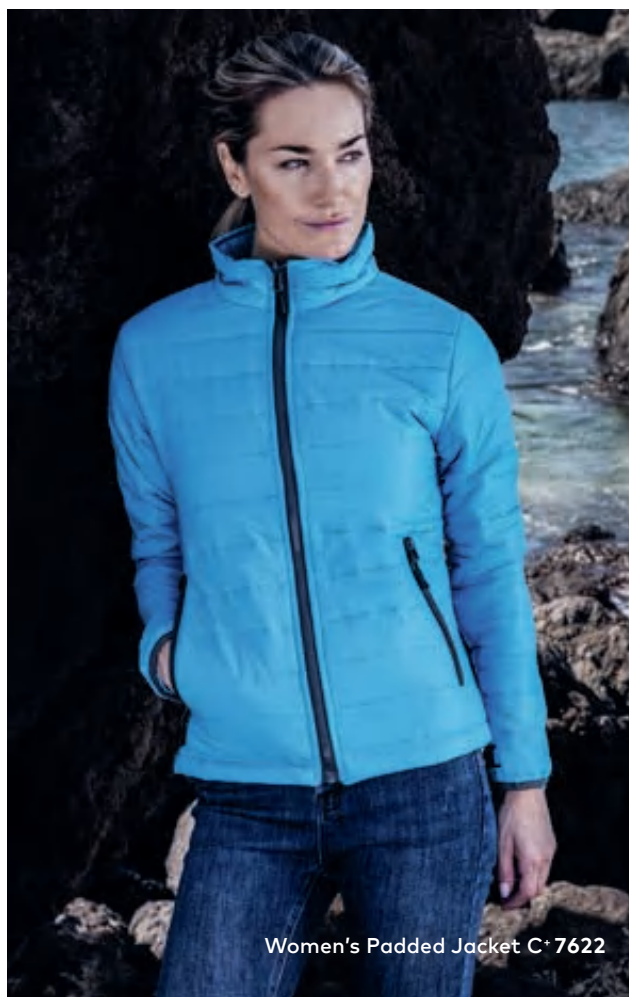
Women's Padded Jacket C+ 7622

Wattierte Jacke mit Stehkragen, durchgehendem Reißverschluss und 2 Seitentaschen mit Reißverschluss sowie Fixierung für Außenjacke, hergestellt aus Nylon (Außen-/Innenmaterial) und Polyester (Wattierung). Die Jacke ist sportlich geschnitten. Jacken Konzept 6-in-1, kombinierbar mit Außenjacke 7548/7549.