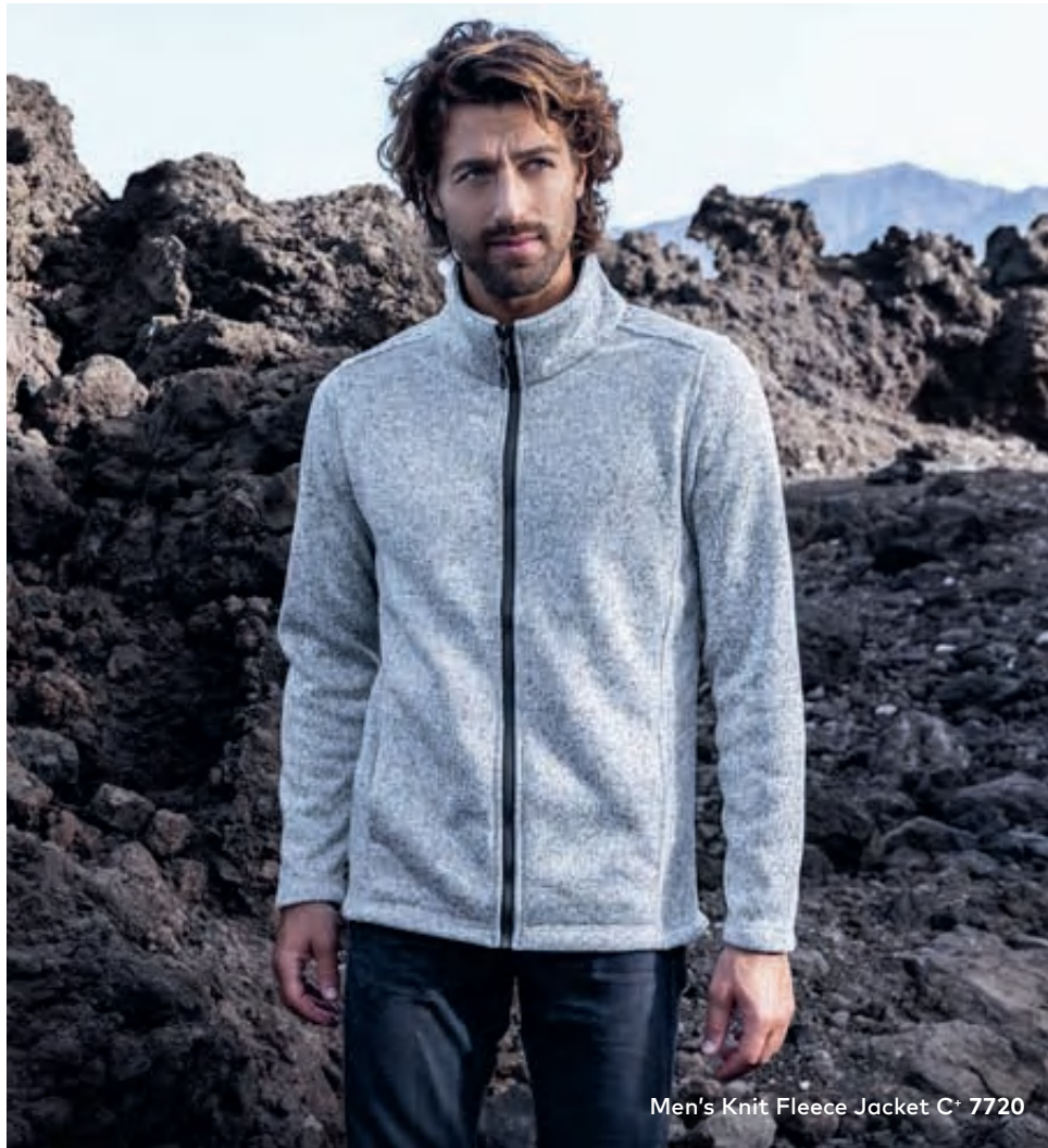
Men's Knit Fleece Jacket C + 7720