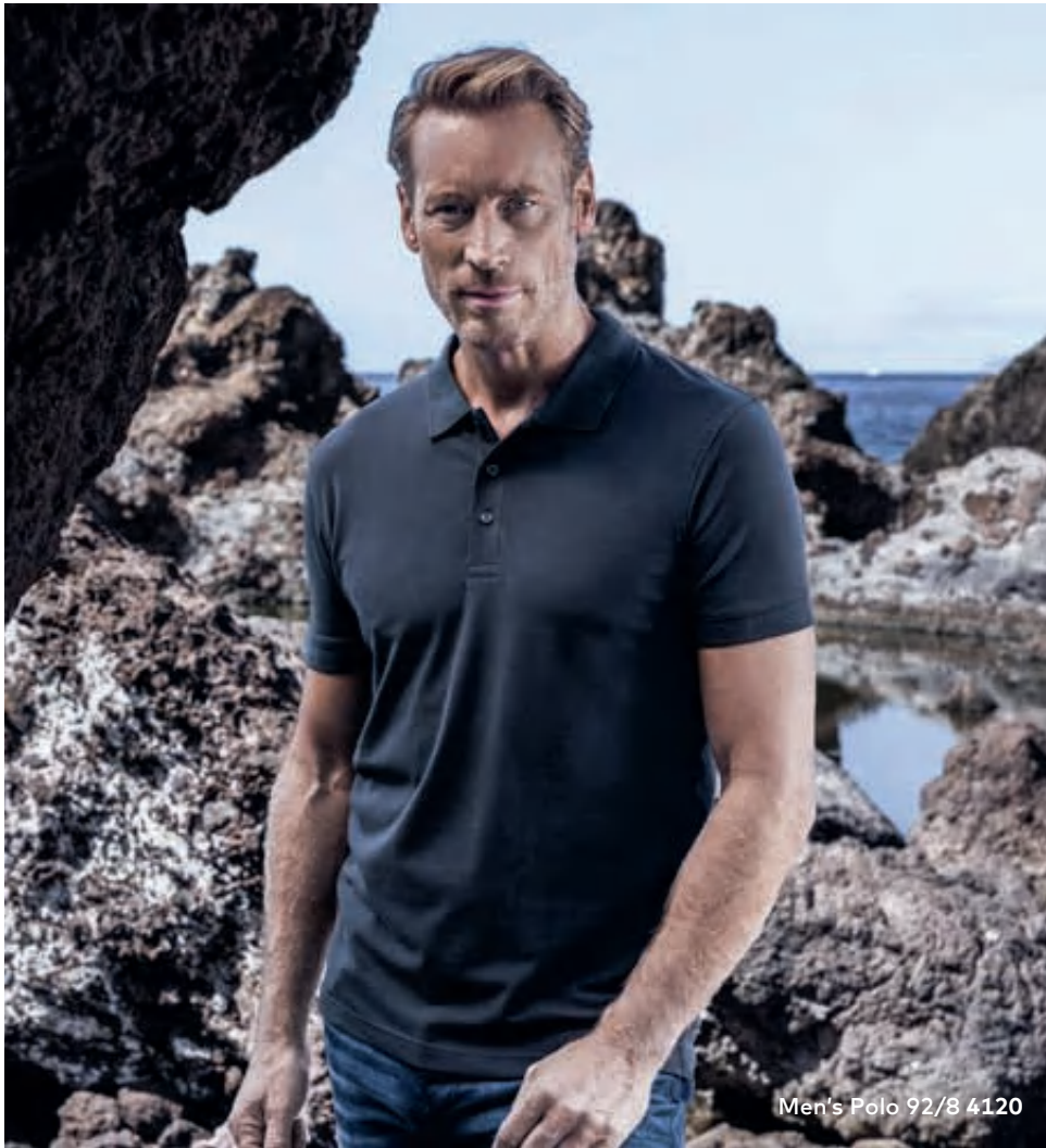
Men's Polo 92/8 4120