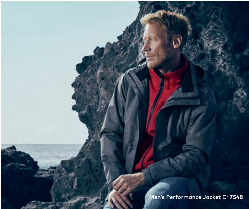
Men's Performance Jacket C + 7548