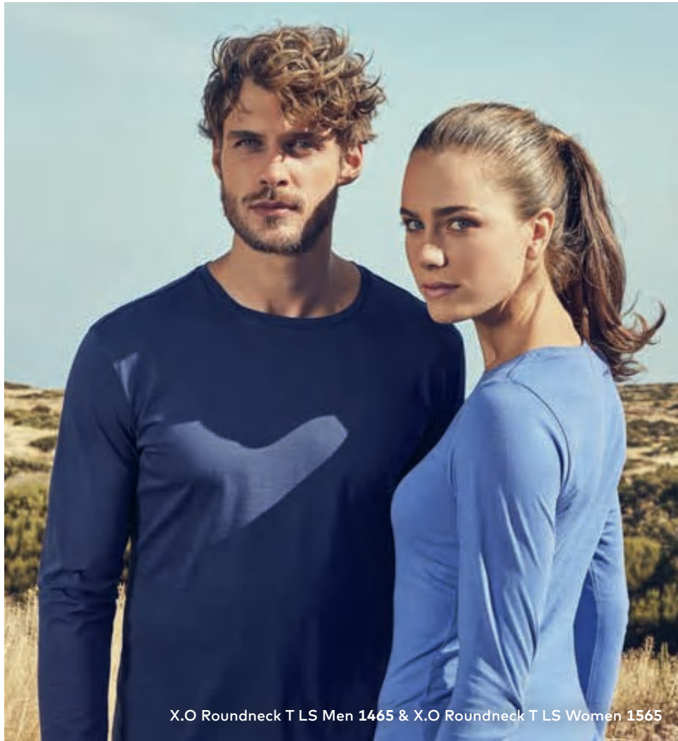
X.O Roundneck T LS Men 1465 & X.O Roundneck T LS Women 1565

Einzigartiges Single-Jersey Langarmshirt mit Self-Fabric Kragen, hergestellt aus langstapeliger gekämmter Baumwolle. Die besonders glatte Oberfläche und der weich fallende Stoff verleihen dem Shirt ein einzigartiges, elastisches und seidiges Finish. Das T-Shirt ist schmal geschnitten und mit Seitennähten gefertigt.