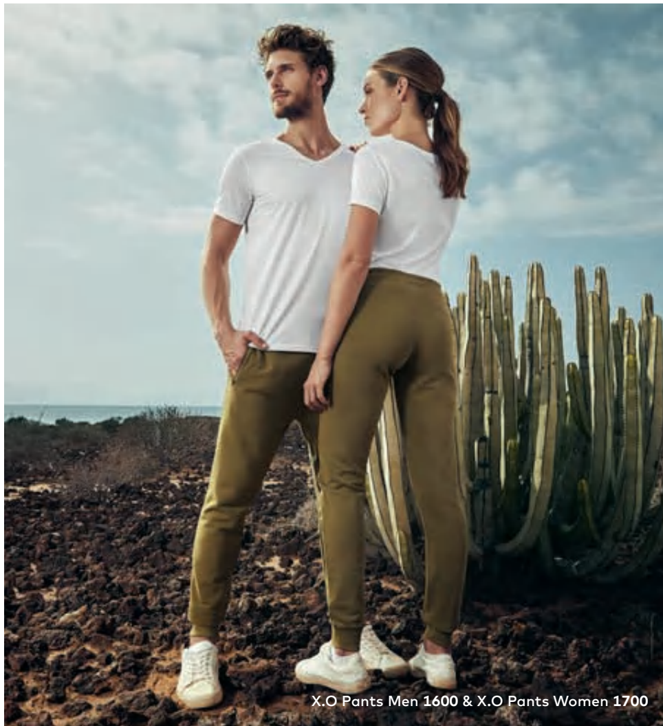
X.O Pants Men 1600 & X.O Pants Women 1700

Einzigartige Molton-Mischgewebe-Sweatpants, unbrushed, Bund mit Kordelzug, 2 Seitentaschen mit coated Ton-in-Ton Reißverschluss, Elasthanbündchen am Bund und Beinabschluss, hergestellt aus langstapeliger gekämmter Baumwolle und Polyester. Die besonders glatte Oberfläche und der weich fallende Stoff verleihen der Sweatpants ein einzigartiges, elastisches und seidiges Finish. Die Sweatpants ist schmal geschnitten.