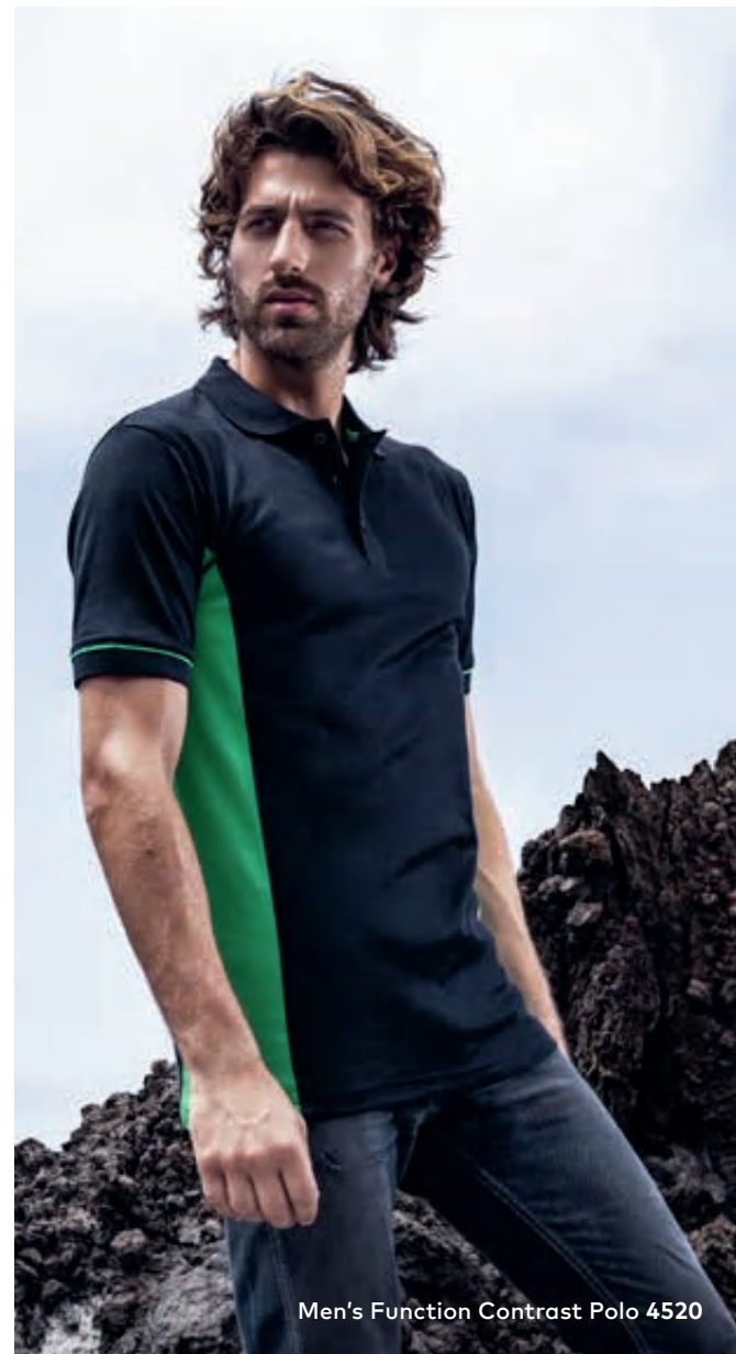
Men's Function Contrast Polo 4520