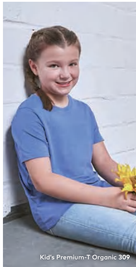
Kid's Premium-T Organic 309

Modernes Unisex-Single-Jersey-T-Shirt mit Elasthananteil im schmalen Rippbündchen, hergestellt aus langstapeliger gekämmter zertifizierter (Bio-) Baumwolle, die besonders feine Oberfläche ist hervorragend geeignet für jegliche Art der Veredelung. Das T-Shirt ist modern geschnitten und mit Seitennähten gefertigt.