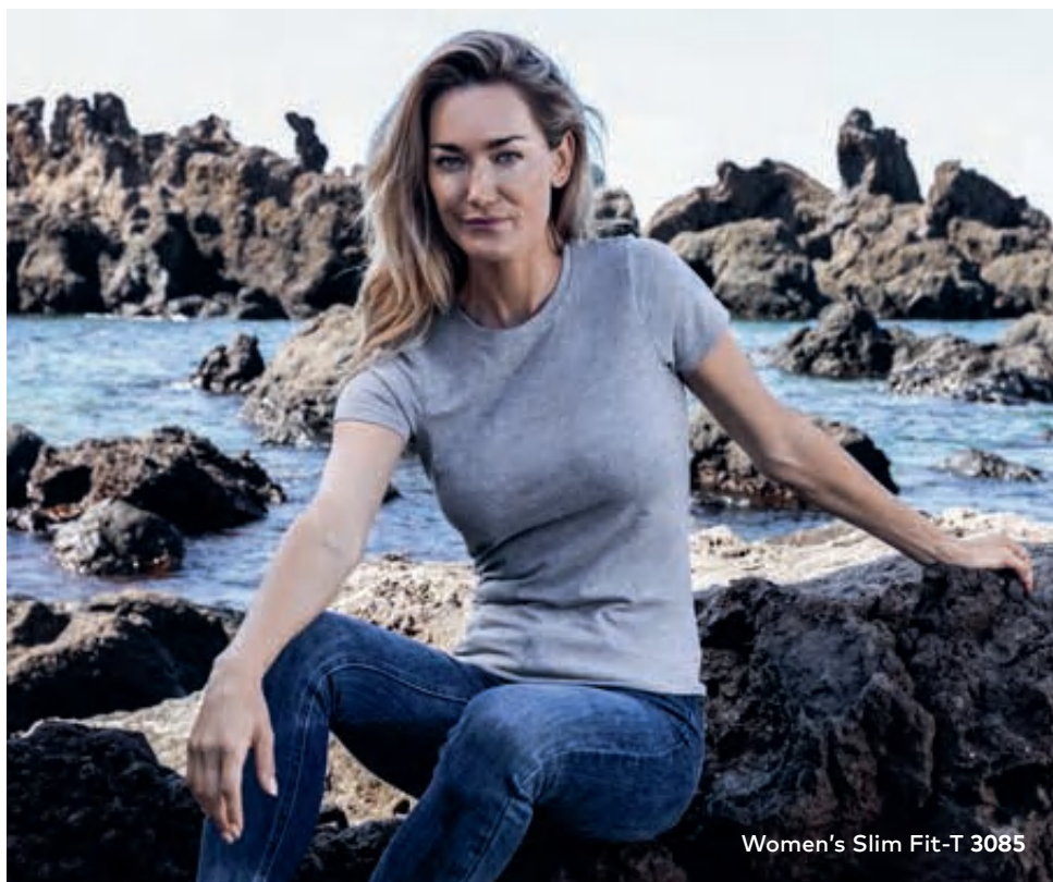
Women's Slim Fit-T 3085