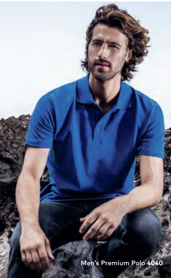
Men's Premium Polo 4040