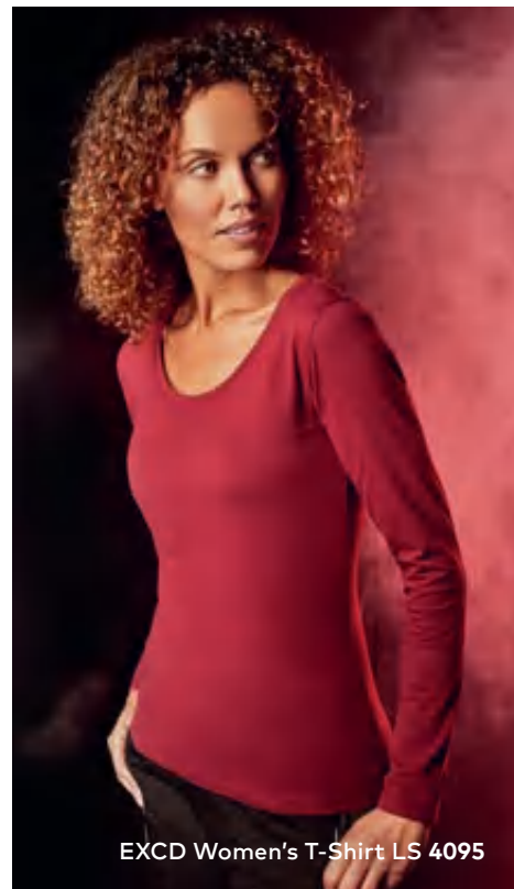
EXCD Women's T-Shirt LS 4095

Langarm-Workwear-Single-Jersey-Mischgewebe-T-Shirt mit femininem Ausschnitt bei Women und Elasthananteil im schmalen Ribbündchen, Schlaufen in der Seitennaht innen, hergestellt aus langstapeliger Baumwolle und Polyester mit der VORTEX® Spinning Technology. Die extrem glatte Oberfläche ist pillingresistent und hervorragend geeignet für jegliche Art der Veredelung. Verstärkte Schulter- und Doppelnähte sowie ein Nackenband vervollständigen dieses Produkt. EXCD überzeugt durch überdurchschnittlich langlebige Qualität, minimale Einlaufwerte und ist besonders pflegeleicht. Das EXCD Langarm-T-Shirt hat eine optimale Passform, und ist mit Seitennähten gefertigt. Dank des hohen Baumwollanteils bietet es maximalen Tragekomfort, für Industriewäsche geeignet, getestet nach ISO 15797.