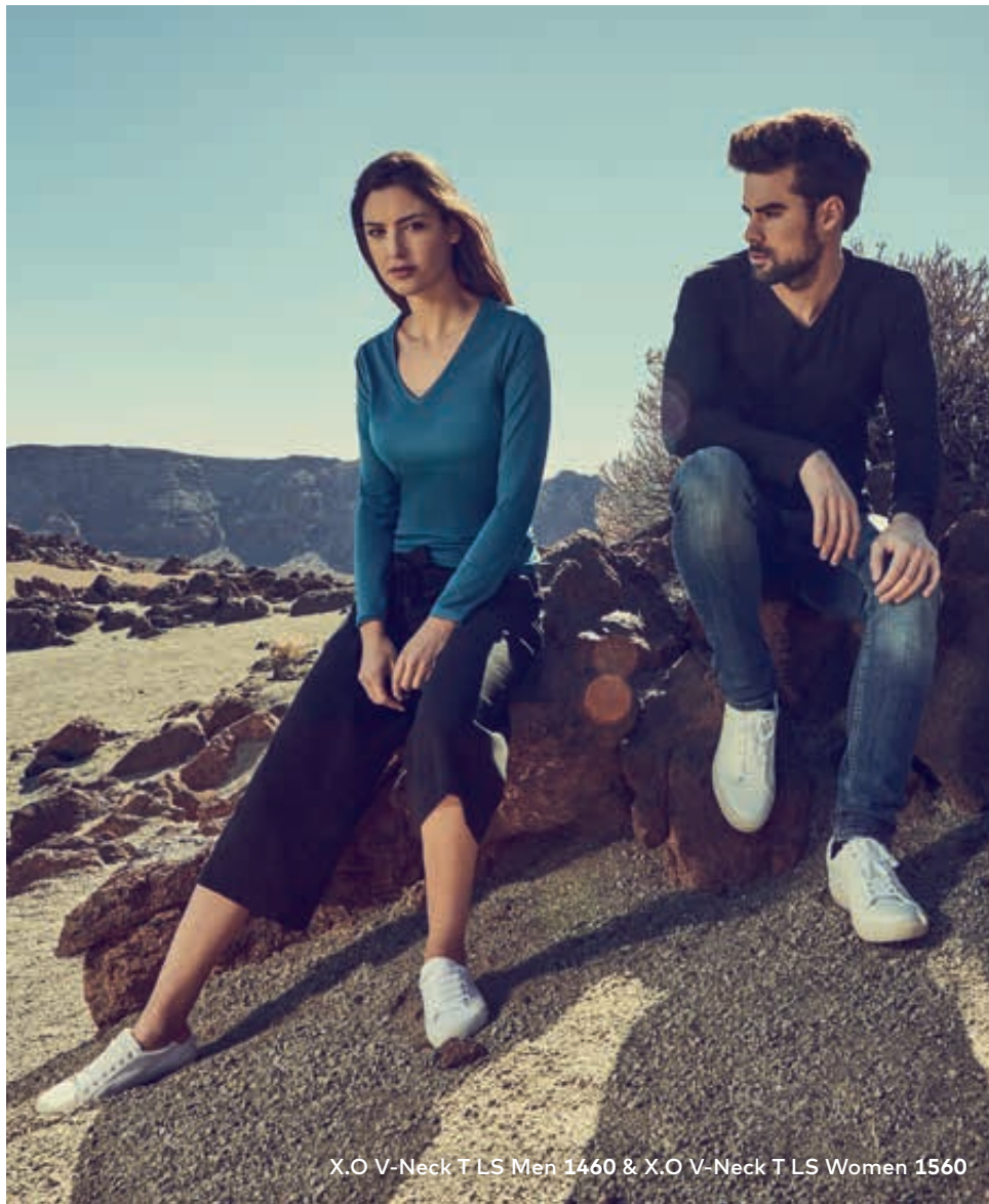
X.O V-Neck T LS Men 1460 & X.O V-Neck T LS Women 1560