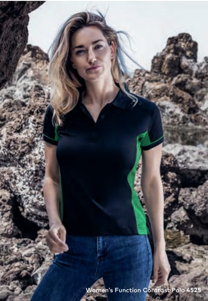
Women's Function Contrast Polo 4525