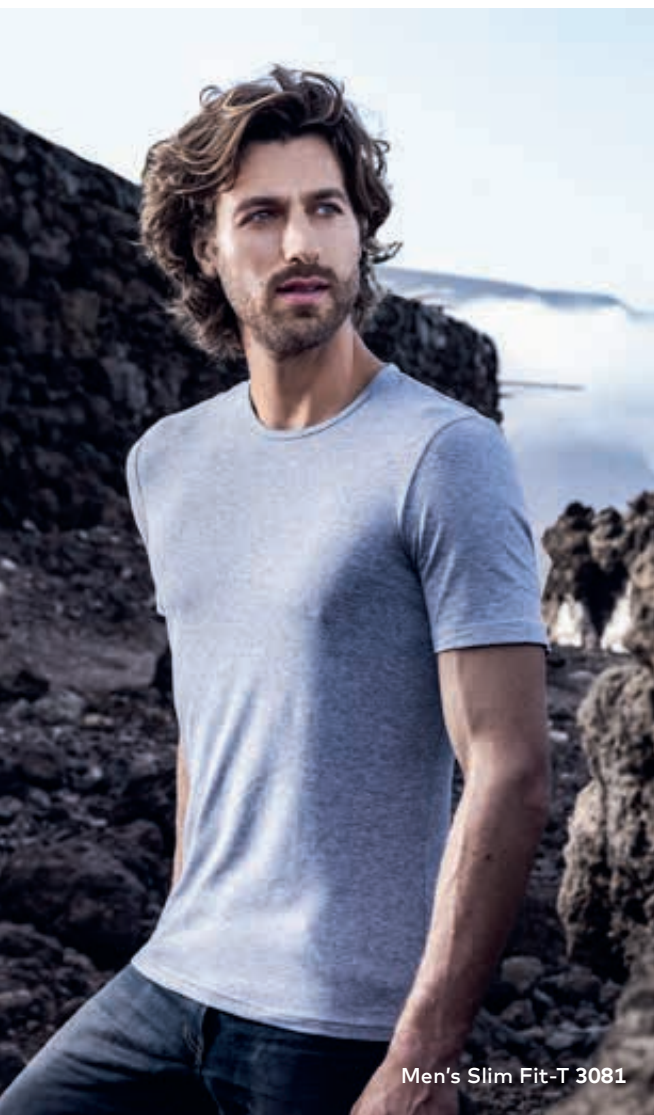
Men's Slim Fit-T 3081

* Farbe sports grey: 95% Baumwolle 5% Elasthan