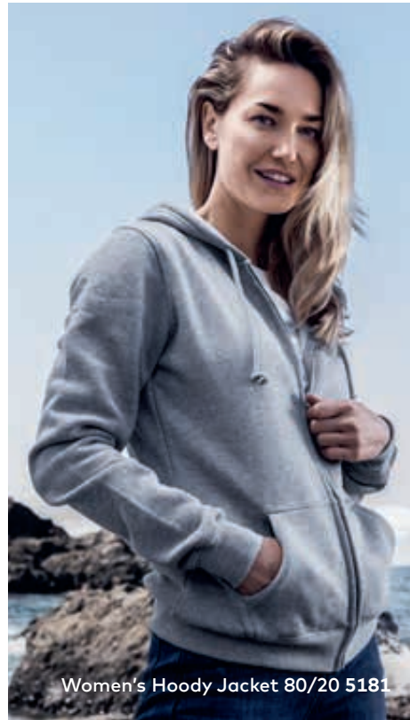
Women's Hoody Jacket 80/20 5181

Klassische Molton-Mischgewebe-Kapuzensweatjacke mit angerauter Innenseite und Elasthanbündchen an Ärmeln und Saum sowie einer Kängurutasche, Doppelkapuze und durchgehendem, verdecktem nickelfreiem Metallreißverschluss, hergestellt aus gekämmter Baumwolle und Polyester. Die Kapuzensweatjacke ist modern geschnitten.