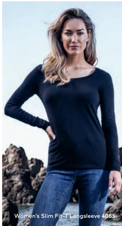
Women's Slim Fit-T Longsleeve 4085

Modernes Single-Jersey-Langarmshirt mit Elasthananteil im Rippbündchen, mit weitem Rundhalsausschnitt, hergestellt aus gekämmter Baumwolle mit Elasthananteil für mehr Bewegungsfreiheit. Das Langarmshirt ist eng anliegend geschnitten und mit Seitennähten gefertigt.