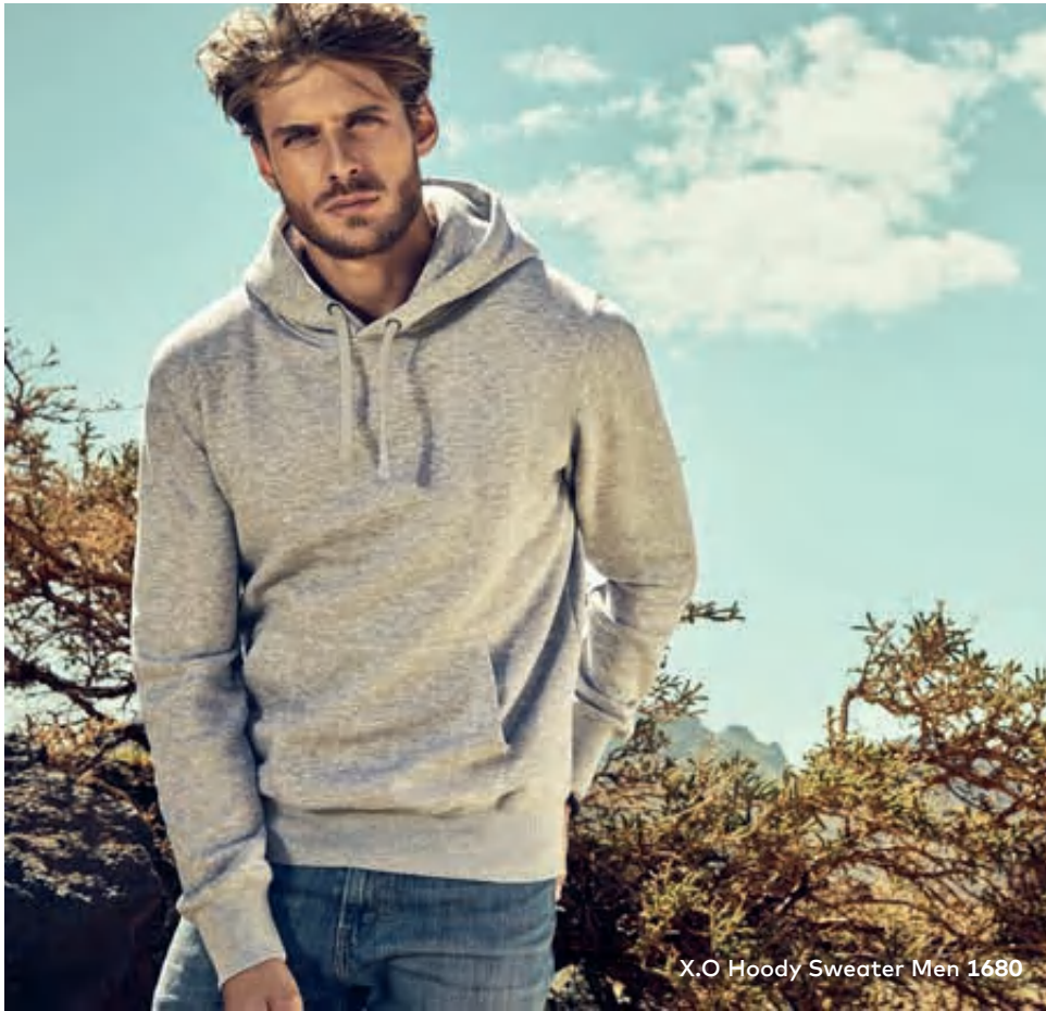
X.O Hoody Sweater Men 1680