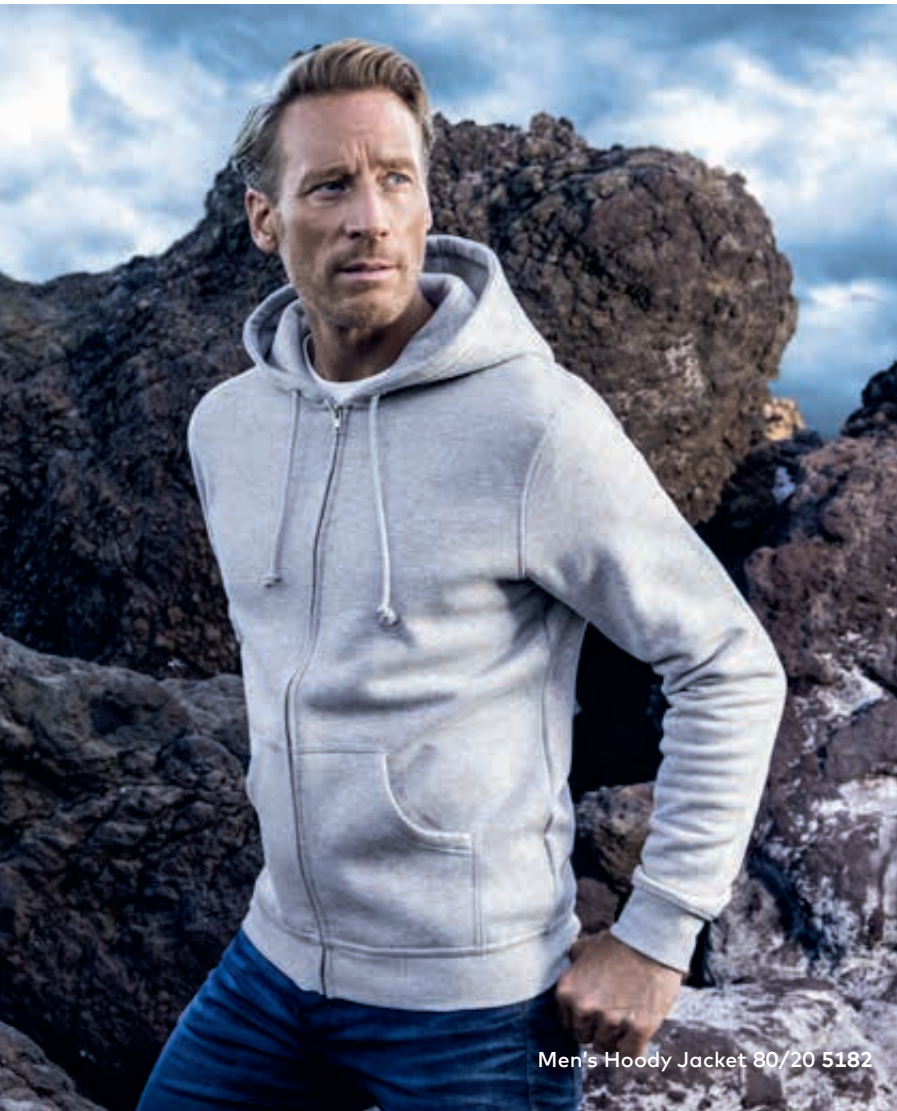
Men's Hoody Jacket 80/20 5182

* Farbe sports grey: 75 % Baumwolle 17 % Polyester 8 % Viskose