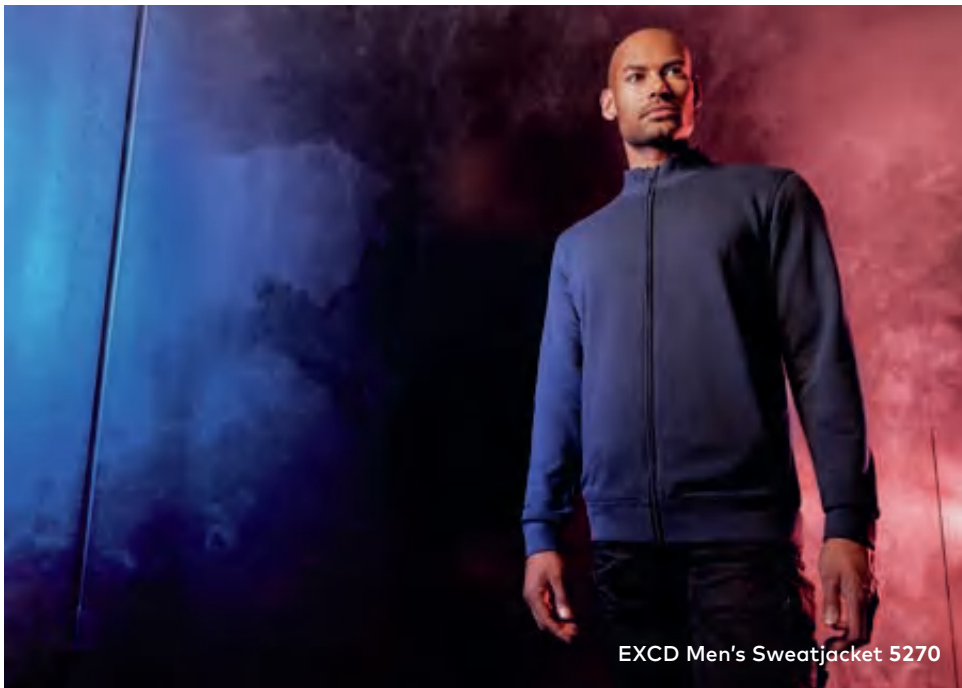
EXCD Men's Sweatjacket 5270

Workwear-Molton-Unbrushed-Mischgewebe-Sweatjacke mit Self-Fabric Stehkragen und Halbmond im Nacken, durchgehender und verdeckter Ton in Ton-Reißverschluss, 2 Seitentaschen mit Reißverschluss auf der Vorderseite, Elasthanbündchen an Ärmeln und Saum, Schlaufen in der Seitennaht innen, hergestellt aus langstapeliger Baumwolle und Polyester mit der VORTEX® Spinning Technology. Die extrem glatte Oberfläche ist pillingresistent und hervorragend geeignet für jegliche Art der Veredelung. Verstärkte Schulter- und Doppelnähte sowie ein Nackenband vervollständigen dieses Produkt. EXCD überzeugt durch überdurchschnittlich langlebige Qualität, minimale Einlaufwerte und ist besonders pflegeleicht. Die EXCD Sweatjacke hat eine optimale Passform. Dank des hohen Baumwollanteils bietet es maximalen Tragekomfort, für Industriewäsche geeignet, getestet nach ISO 15797.