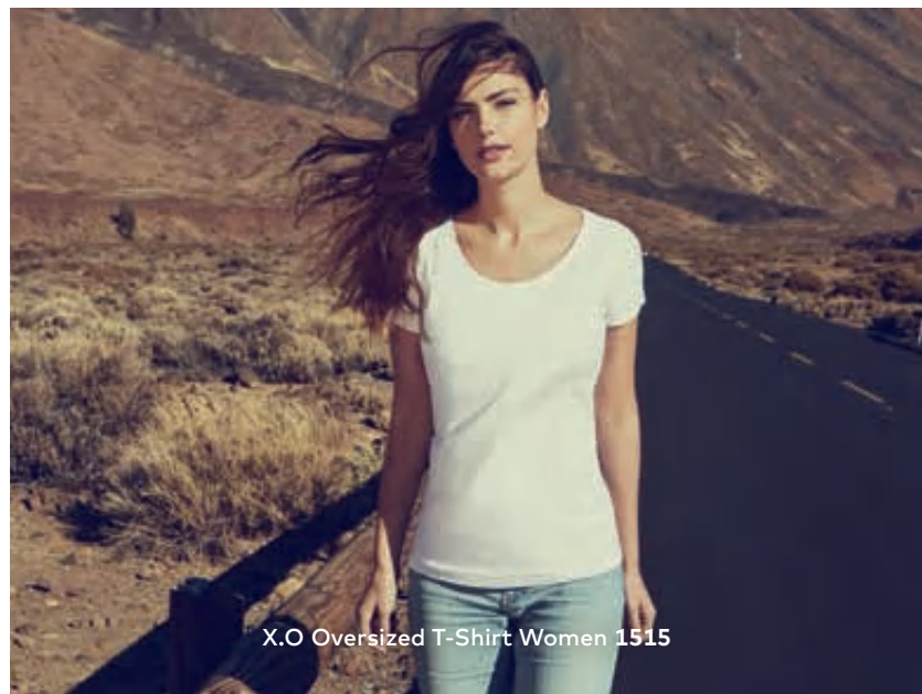
X.O Oversized T-Shirt Women 1515