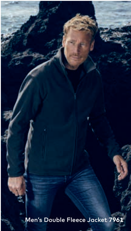
Men's Double Fleece Jacket 7961