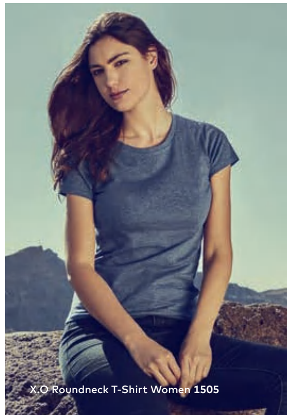
X.O Roundneck T-Shirt Women 1505

Einzigartiges Single-Jersey T-Shirt mit Self-Fabric Kragen, hergestellt aus langstapeliger gekämmter Baumwolle. Die besonders glatte Oberfläche und der weich fallende Stoff verleihen dem Shirt ein einzigartiges, elastisches und seidiges Finish. Das T-Shirt ist schmal geschnitten und mit Seitennähten gefertigt.