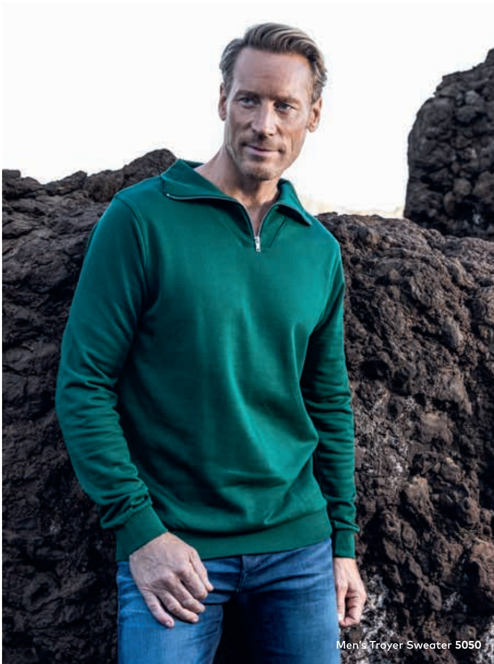
Men's Troyer Sweater 5050