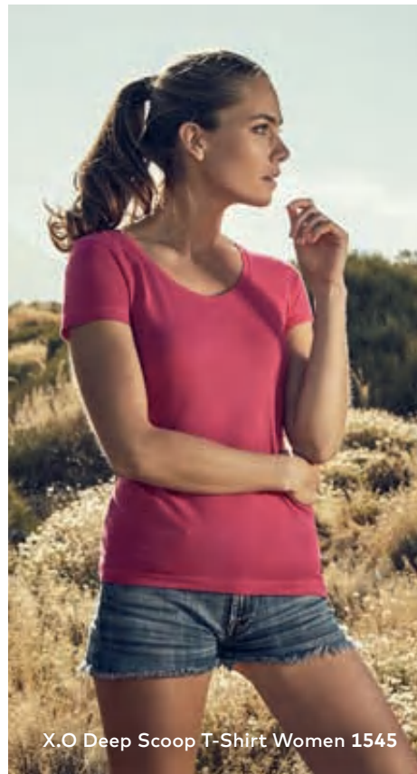
X.O Deep Scoop T-Shirt Women 1545

Einzigartiges Single-Jersey T-Shirt mit tiefem Ausschnitt und Self-Fabric Kragen, hergestellt aus langstapeliger gekämmter Baumwolle. Die besonders glatte Oberfläche und der weich fallende Stoff verleihen dem Shirt ein einzigartiges, elastisches und seidiges Finish. Das T-Shirt ist schmal geschnitten und mit Seitennähten gefertigt.