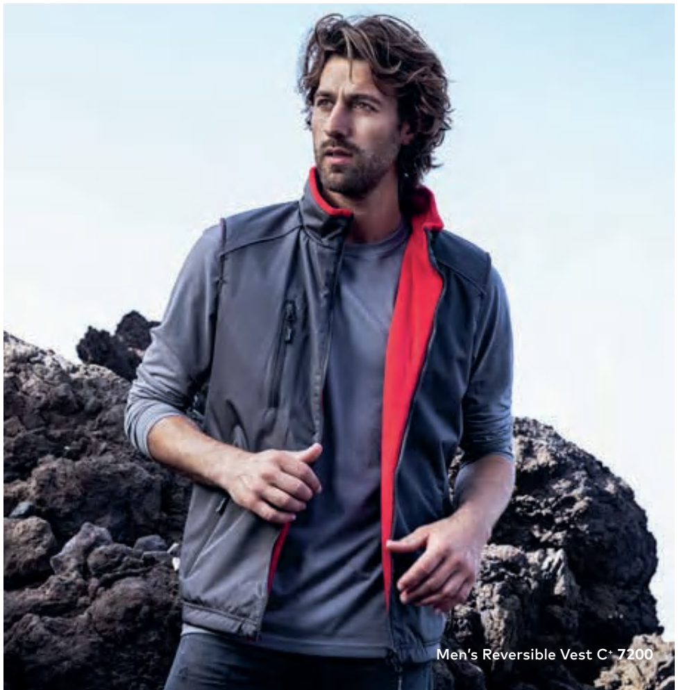
Men's Reversible Vest C+ 7200

Wendeweste, die besonderen Merkmale dieser Jacke: Stehkragen, Napoleontasche auf der Vorderseite, 2 Seitentaschen mit RV auf der Vorder-/Innenseite, eingnähter Schlüsselanhänger in Seitentasche, reflektierende Paspeln und RV Anhänger, Tunnelzug am Saum mit Kordelstopper, abgerundeter Saum, Invisible Zip zum Veredeln, Fixierung für Außenjacke, Fleece Innenseite mit Anti-Pilling Ausrüstung, hergestellt aus 100% Polyester. Die Weste ist modern geschnitten. Jacken Konzept 6-in-1, kombinierbar mit Außenjacke 7548/7549.