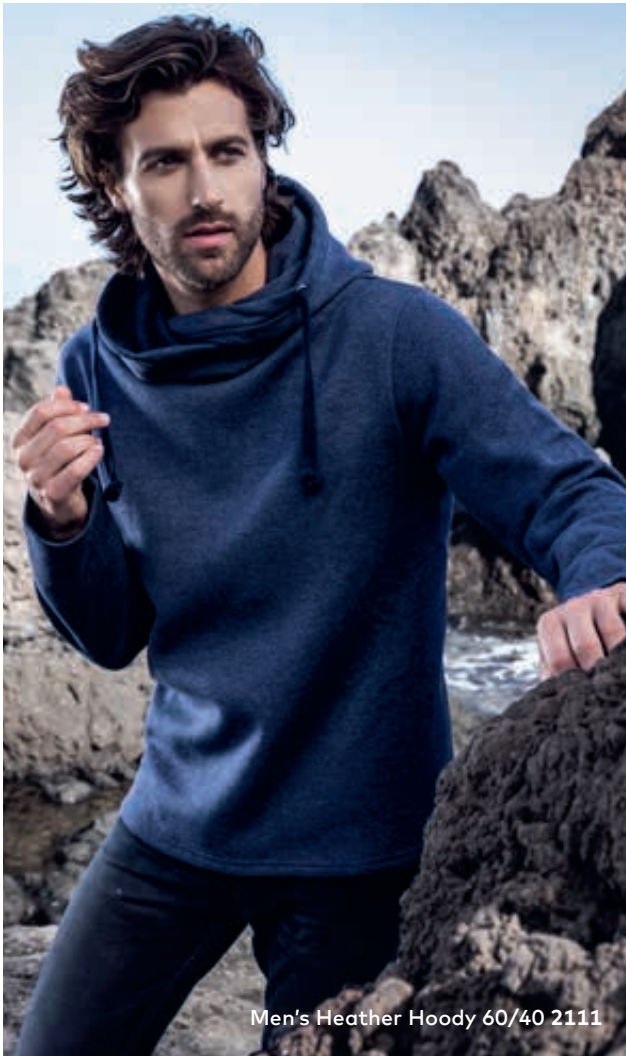
Men's Heather Hoody 60/40 2111