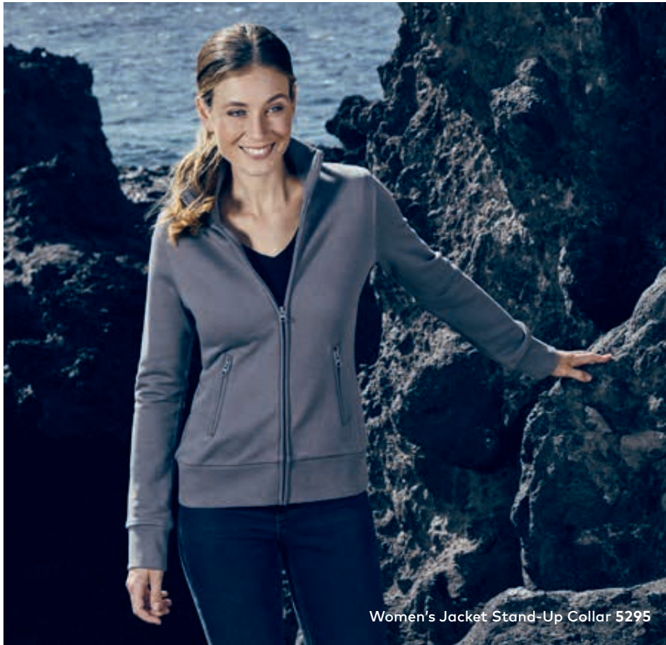
Women's Jacket Stand-Up Collar 5295