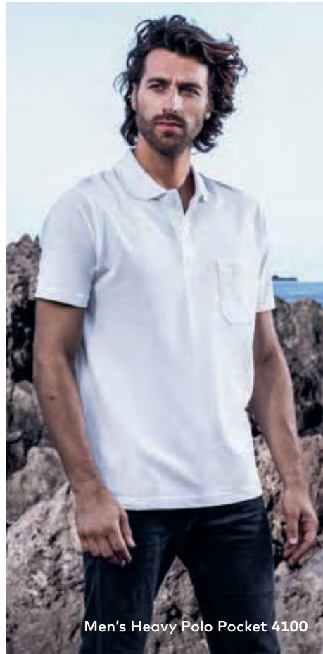
Men's Heavy Polo Pocket 4100

Zeitloses Piqué-Polo mit Brusttasche, Knopfleiste mit 3 Knöpfen Ton in Ton, offene Armabschlüsse sowie Seitenschlitze, hergestellt aus gekämmter Baumwolle. Das Polo ist leger geschnitten.