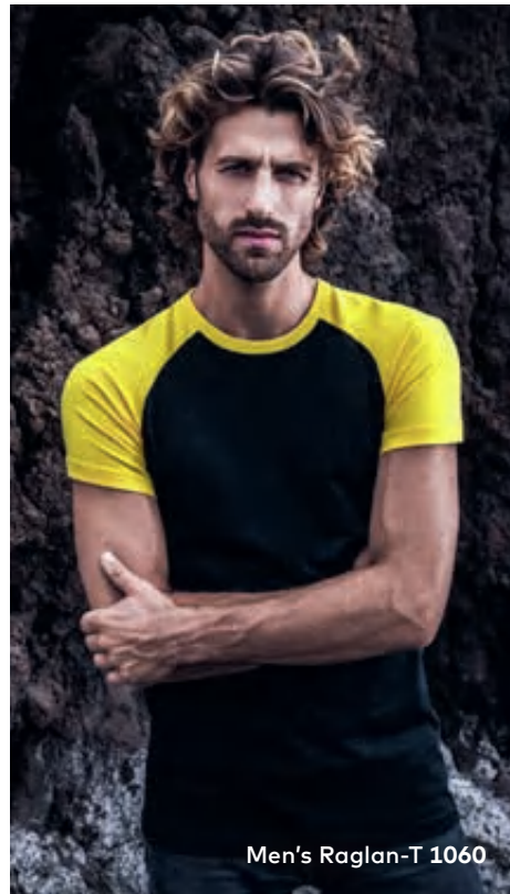
Men's Raglan-T 1060

Zweifarbiges Single-Jersey-T-Shirt mit Raglan-Ärmeln und Krageneinfassung in Kontrastfarbe, hergestellt aus gekämmter Baumwolle. Das Raglan T-Shirt ist klassisch geschnitten und aus Schlauchware gefertigt.