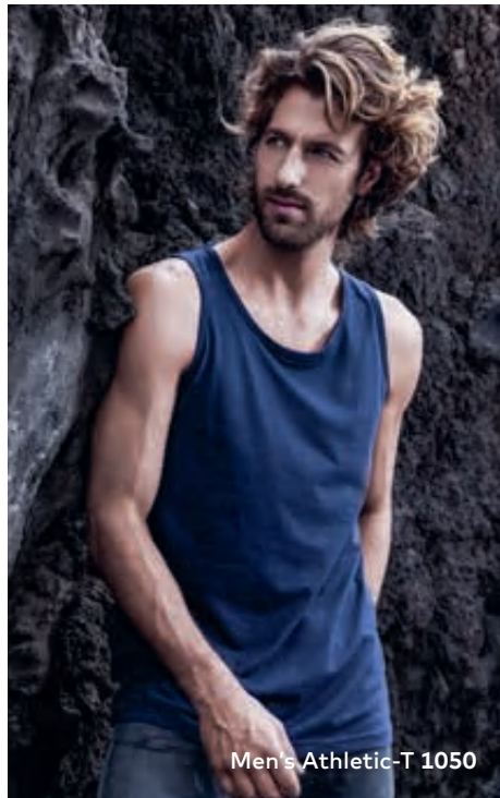
Men's Athletic-T 1050

Zeitloses Single-Jersey-Trägershirt mit eingefasstem Kragen, hergestellt aus gekämmter Baumwolle. Das Trägershirt ist eng anliegend geschnitten und aus Schlauchware gefertigt.