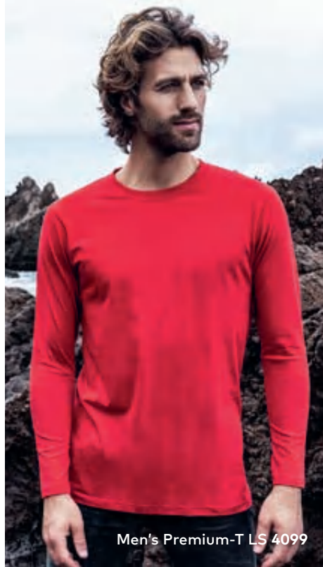
Men's Premium-T LS 4099

Klassisches Single-Jersey-Langarmshirt mit Elasthananteil im schmalen Rippbündchen, hergestellt aus langstapeliger gekämmter Baumwolle, die besonders feine Oberfläche ist hervorragend geeignet für jegliche Art der Veredelung. Das Langarmshirt ist modern geschnitten und aus Schlauchware gefertigt.