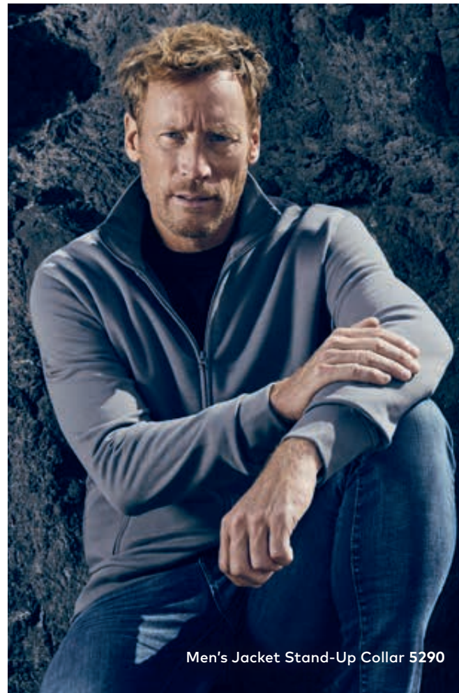
Men's Jacket Stand-Up Collar 5290

Klassische Molton-Sweatjacke mit angerauter Innenseite und Elasthanbündchen an Ärmeln und Saum, Stehkragen, durchgehendem, verdecktem Ton in Ton-Reißverschluss sowie 2 Seitentaschen mit Reißverschluss, hergestellt aus gekämmter Baumwolle. Die Sweatjacke ist modern geschnitten.