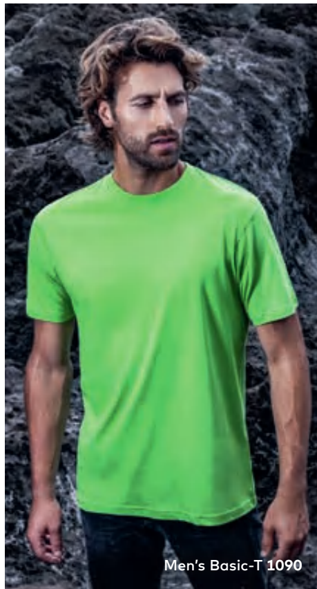
Men's Basic-T 1090

Zeitloses Single-Jersey-T-Shirt mit Elasthananteil im Rippbündchen, hergestellt aus gekämmter Baumwolle. Das T-Shirt ist klassisch geschnitten und aus Schlauchware gefertigt.