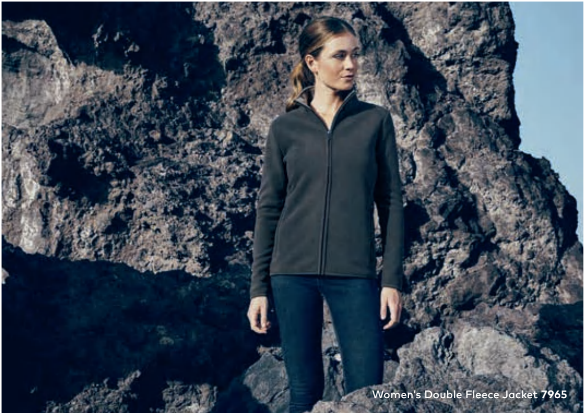
Women's Double Fleece Jacket 7965

Double-Fleecejacke mit Stehkragen und durchgehendem verdecktem Reißverschluss, Elasthanbündchen an Ärmeln sowie 2 Seitentaschen mit Reißverschluss. Die Innenseite der Jacke ist in Kontrastfarbe, hergestellt aus Polyester mit beidseitiger Anti-Pilling-Ausrüstung. Die Fleecejacke ist schmal geschnitten.