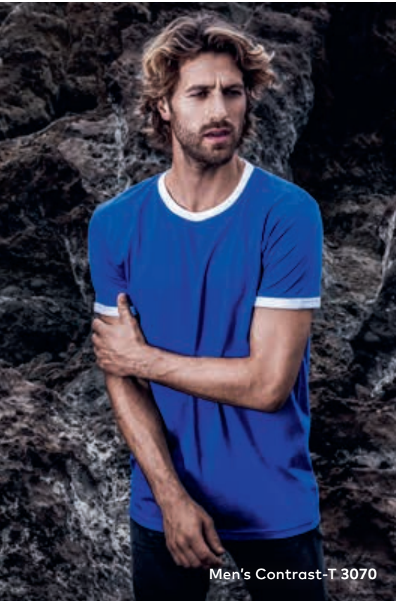
Men's Contrast-T 3070