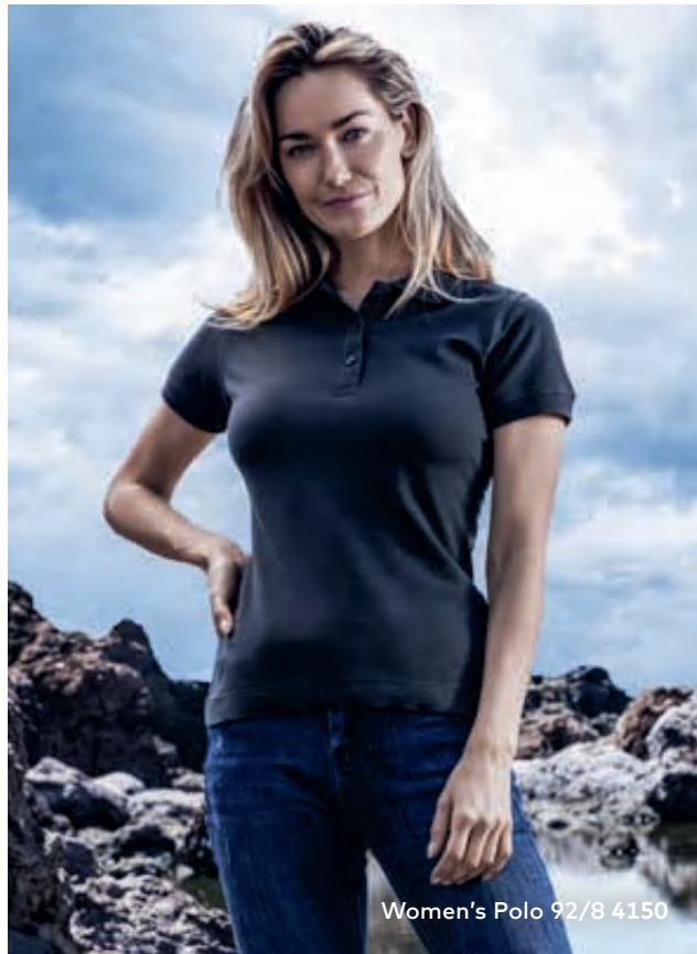
Women's Polo 92/8 4150

Modernes Piqué-Polo mit schmaler Knopfleiste und 3 Knöpfen Ton in Ton sowie Ärmelbündchen, hergestellt aus langstapeliger gekämmter Baumwolle mit Elasthananteil für mehr Bewegungsfreiheit. Das Polo ist modern geschnitten.