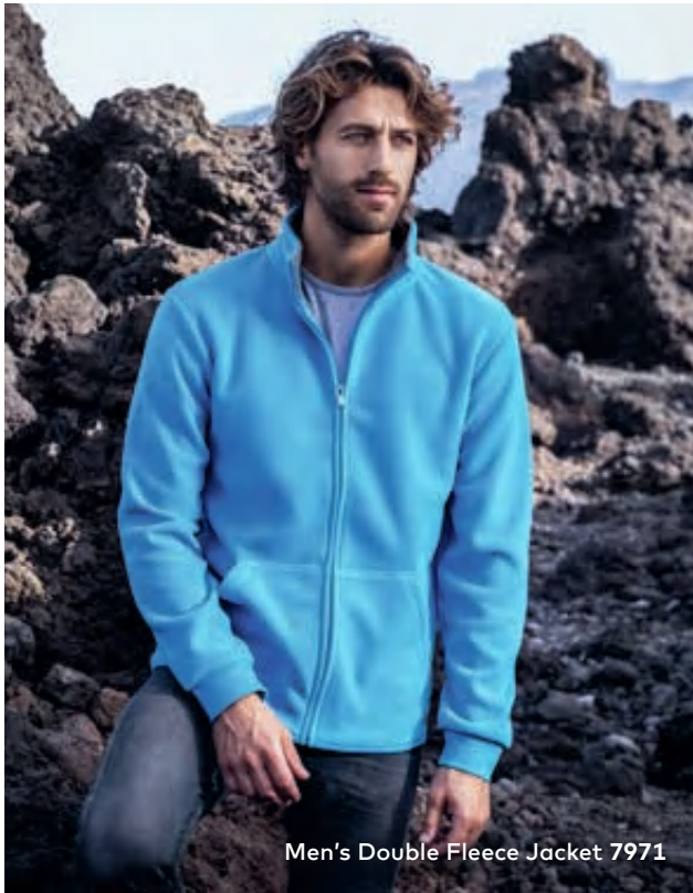
Men's Double Fleece Jacket 7971

7971/7985 | Men: S-5XL, Women: XS-XXXL 320 g/m 2 | 100 % Polyester