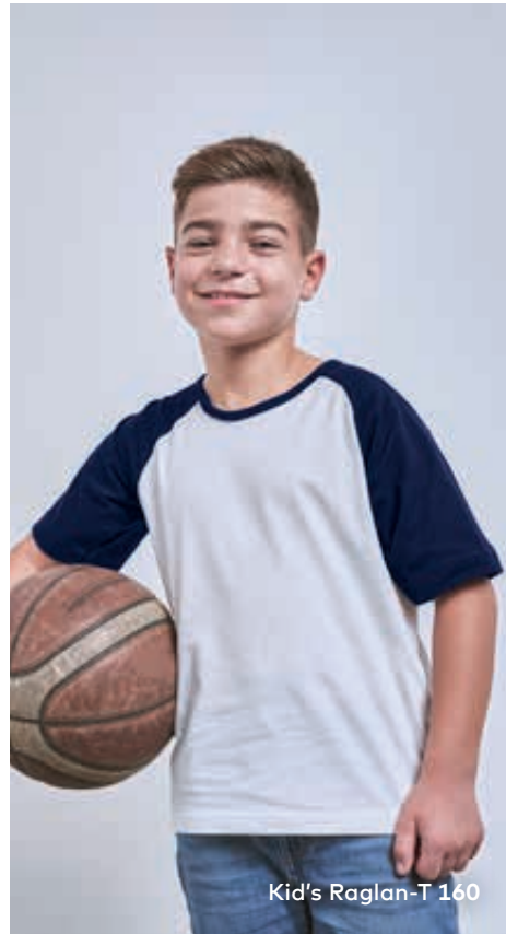
Kid's Raglan-T 160

Zweifarbiges Unisex-Single-Jersey-T-Shirt mit Raglan Ärmeln und Krageneinfassung in Kontrastfarbe, hergestellt aus gekämmter Baumwolle. Das Raglan-T-Shirt ist modisch geschnitten und mit Seitennähten gefertigt.