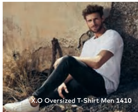
X.O Oversized T-Shirt Men 1410

Einzigartiges Oversized Single-Jersey T-Shirt mit Self-Fabric Kragen, hergestellt aus langstapeliger gekämmter Baumwolle. Die besonders glatte Oberfläche und der weich fallende Stoff verleihen dem Shirt ein einzigartiges, elastisches und seidiges Finish. Das T-Shirt ist oversized geschnitten und mit Seitennähten gefertigt.