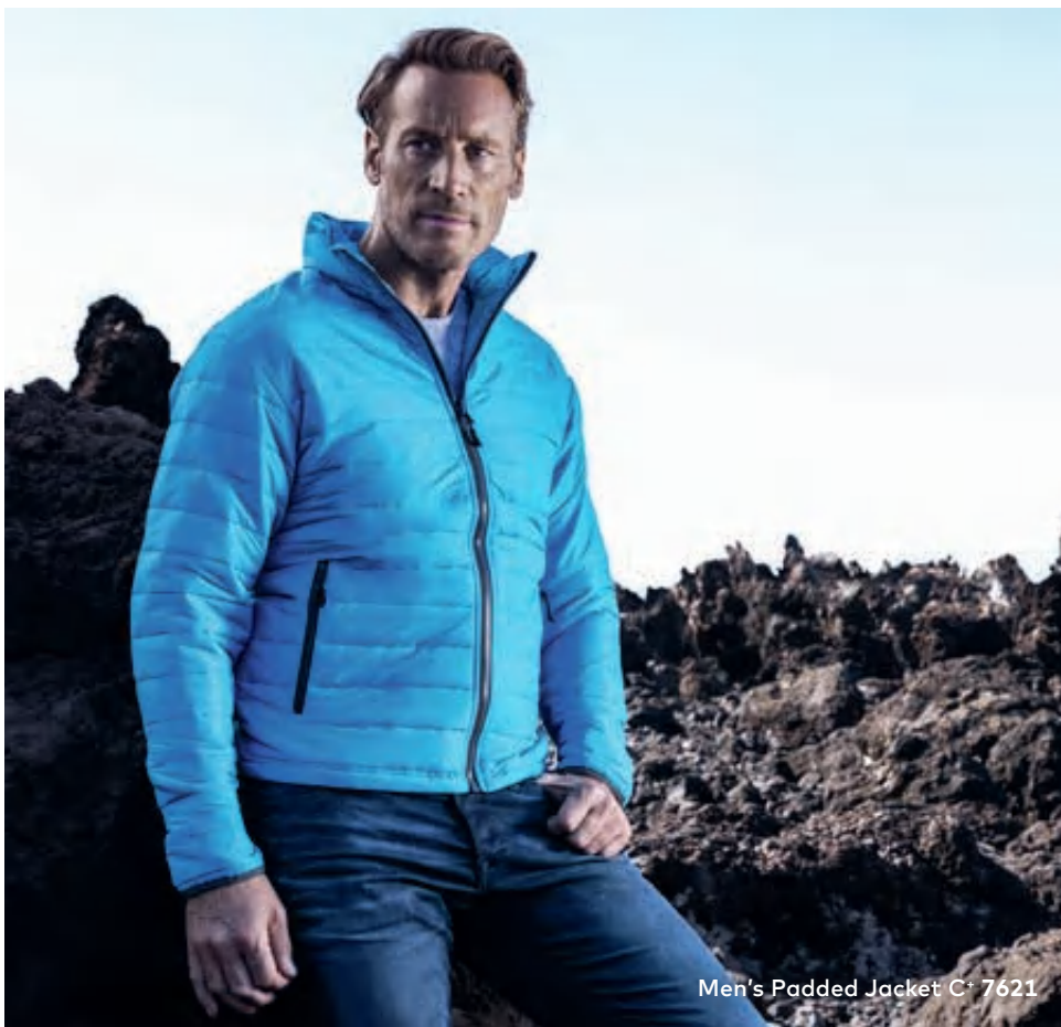
Men's Padded Jacket C+ 7621