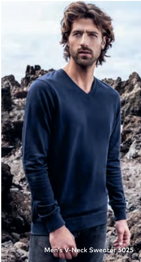
Men's V-Neck Sweater 5025