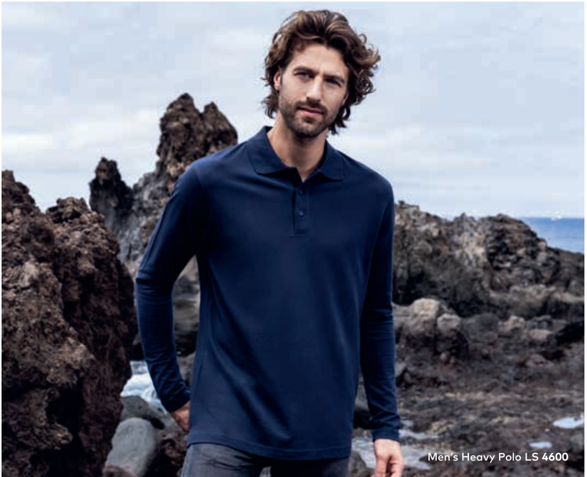
Men's Heavy Polo LS 4600