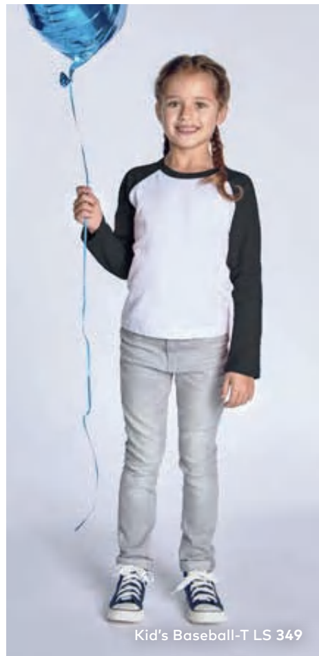
Kid's Baseball-T LS 349

Zweifarbiges Unisex-Heavy-Jersey-Langarmshirt mit Raglan-Ärmeln und Krageneinfassung in Kontrastfarbe, hergestellt aus gekämmter Baumwolle. Das Raglan-Langarmshirt ist modern geschnitten und mit Seitennähten gefertigt.