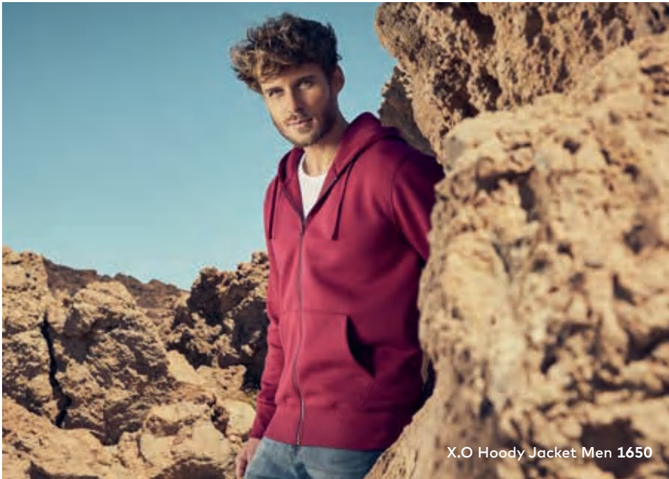
X.O Hoody Jacket Men 1650